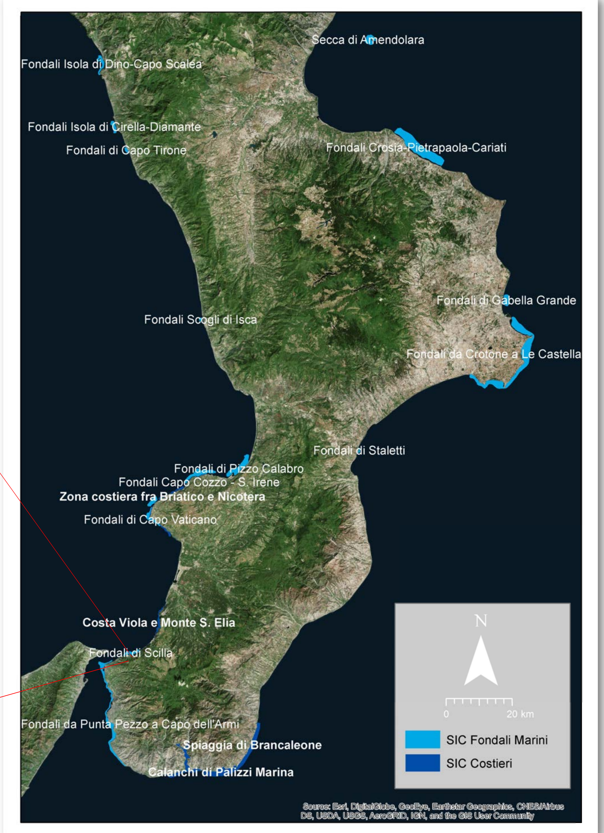
Mappa generale siti SIC