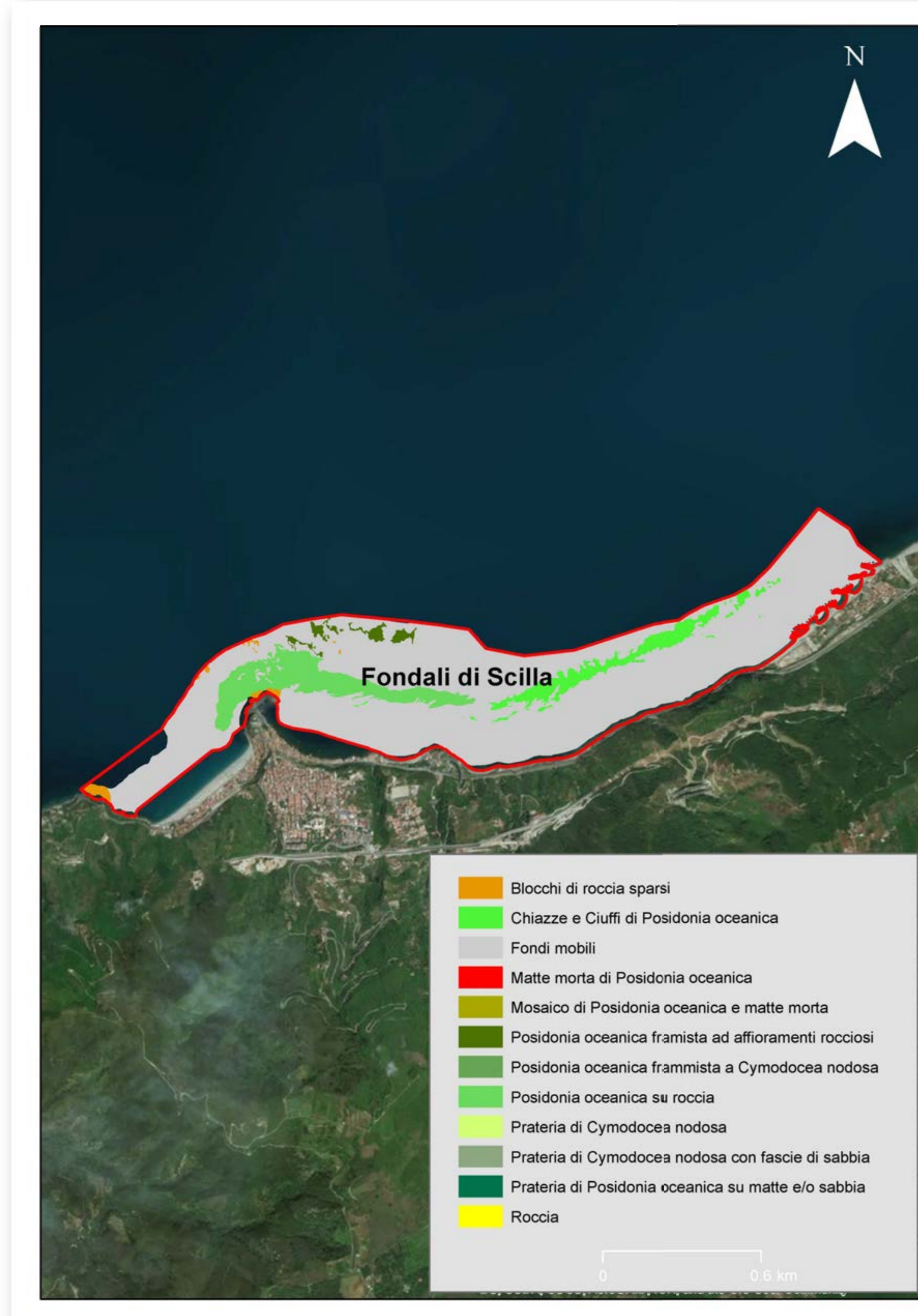
Mappatura prateria anno 2003