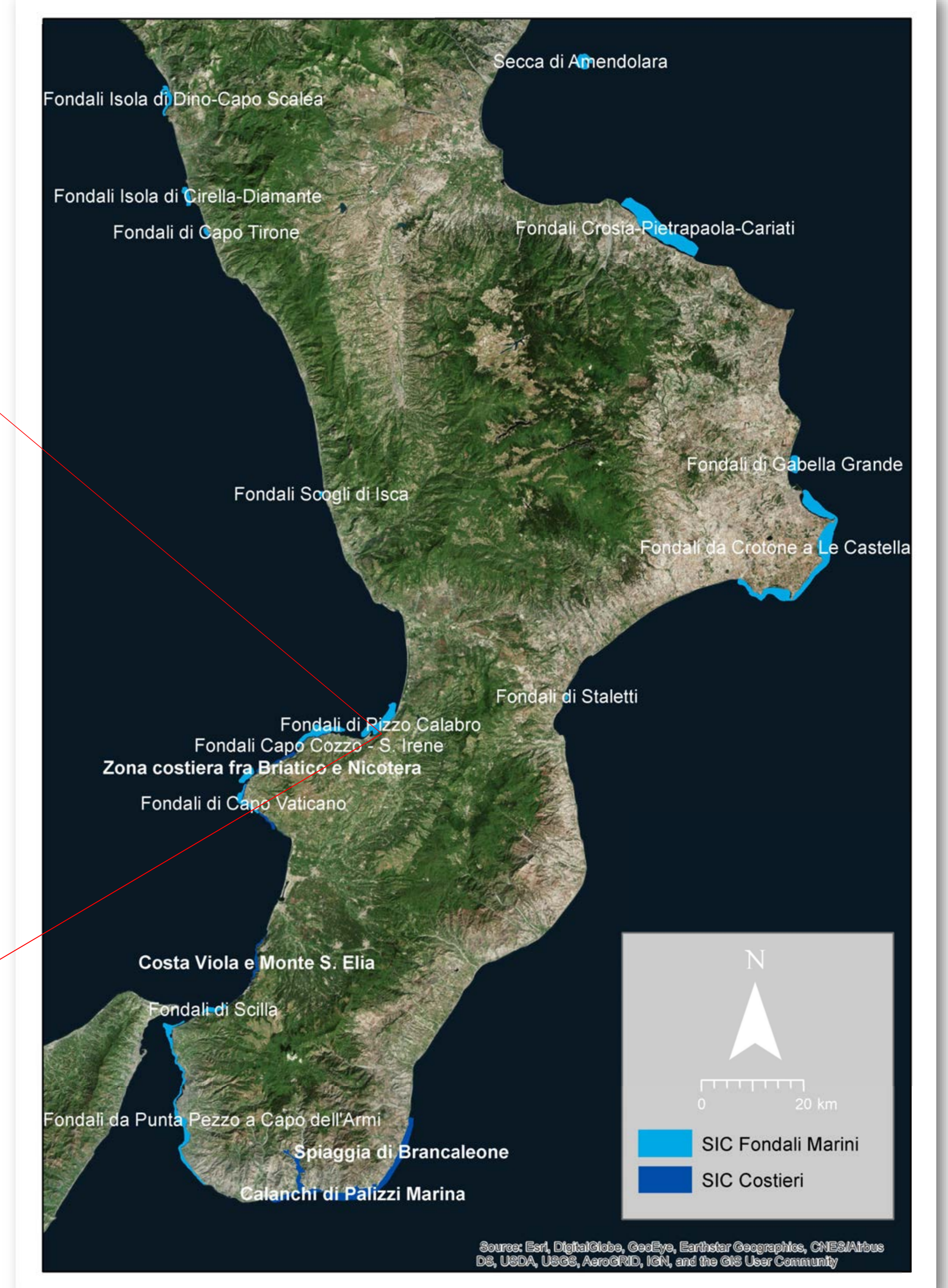
Mappa generale siti SIC