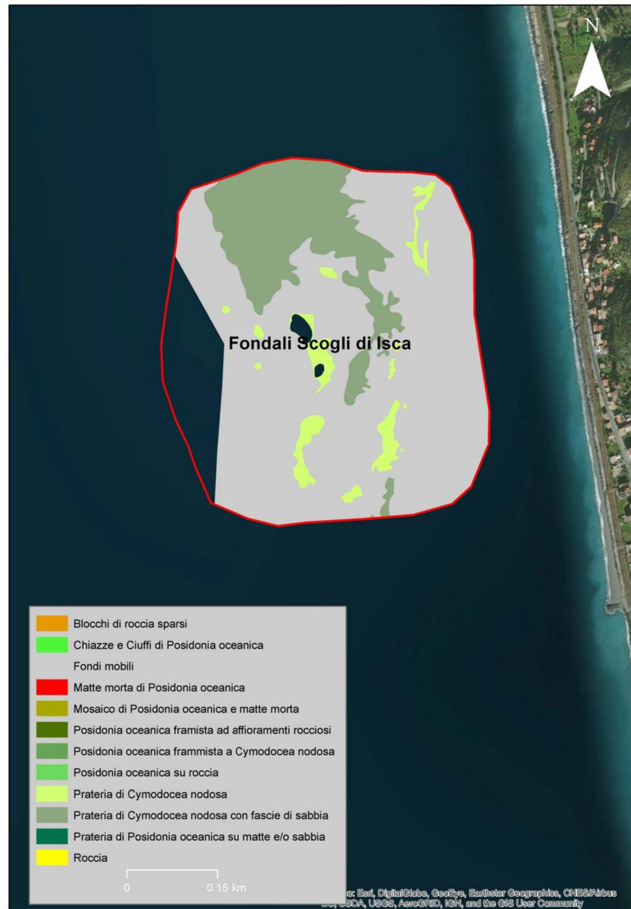
Mappatura prateria anno 2003